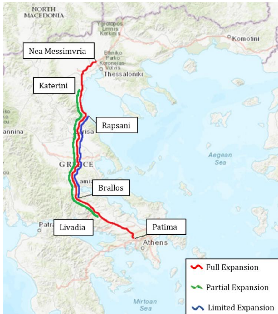
Фигура 1: Опростена схема на предложените нива на Expansion

за разширение включват дублиране на главния клон на системата на DESFA с 30" газопровод, както и подобряване на Компресорните станции (CS).